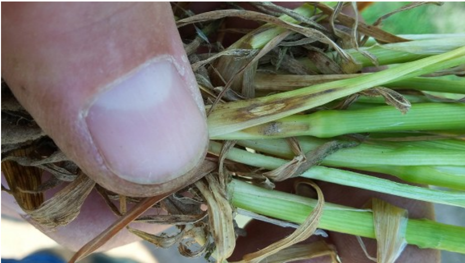
Foto 2. Angreb af knækkefodsygge i hvede fotograferet 10. maj. I marken var 1/4-1/3 af planterne angrebne. Behovet for bekæmpelse af knækkefodsygge forventes at være lavt, men tjek markerne for evt. angreb.